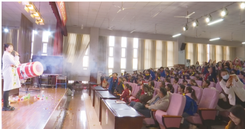
趣味实验现场,同学们积极互动。

随后,“看不见的手”实验接棒登场。基于伯努利原理,工作人员通过简单的道具演示空气流动的规律:只见一张薄纸在气流作用下悬浮在空中,仿佛被一双无形的手托举着;小球在气流中稳定旋转,即便改变方向也不会掉落。同学们看得目不转睛,有的忍不住伸出小手,试图“捕捉”到这双神秘的“看不见的手”,脸上满是好奇与期待。在互